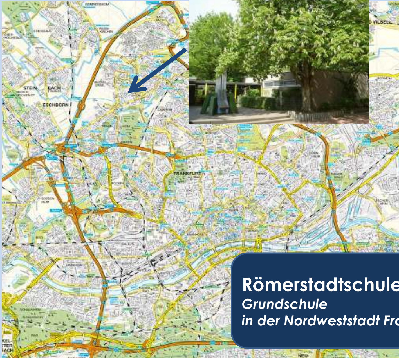
Römerstadtschule Grundschule in der Nordweststadt Frankfurts