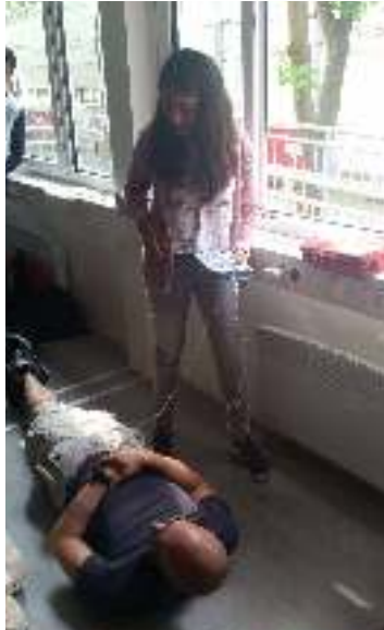
Abb.4: Einsatz des Defibrillators

Zum Abschluss der AG und als Voraussetzung für die Teilnahme am zukünftigen Schulsanitätsdienst fand am Ende des zweiten Schulhalbjahres (7. und 8.06.2018) eine zweitägige Erste-Hilfe-Ausbildung durch die Kurzeit GmbH – Erste Hilfe rettet Leben statt! In diesen zwei Tagen haben die Gymnasiasten durch die AG erlerntes Wissen vertieft und über Rollenspiele Fallbeispiele bearbeitet. Beispielsweise wurde zwischen der Herz-Lungen-Massage bei einem Herzstillstand und dem Einsatz eines Defibrillators bei Kammerflimmern unterschieden.