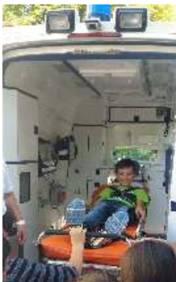
Abb.2+3: Der Rettungswagen