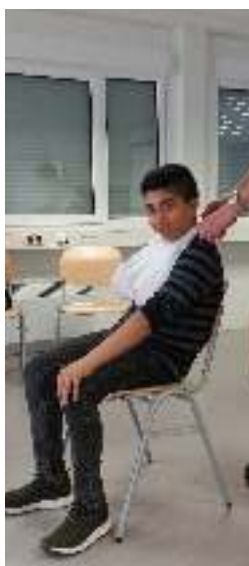
Abb.1 : Anlegen des Dreieckstuchs

Für die Heranführung an die Erste Hilfe konnte für eine Einführungsveranstaltung die Unterstützung des Arbeiter-Samariter-Bund (ASB) aus Höchst gewonnen werden! Neben wichtigen Erste-Hilfe-Maßnahmen wurden die Arbeit von Rettungssanitätern, ein Rettungswagen und das Einsatzmaterial vorgestellt und besichtigt.