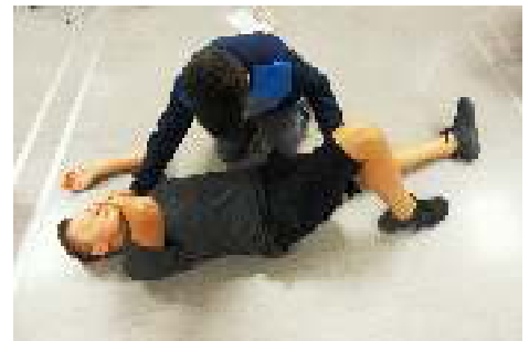
Abb.6: Stabile Seitenlage

Jedes Mitglied der AG konnte somit durch seine dort erbrachten Leistungen ein Zertifikat erhalten!