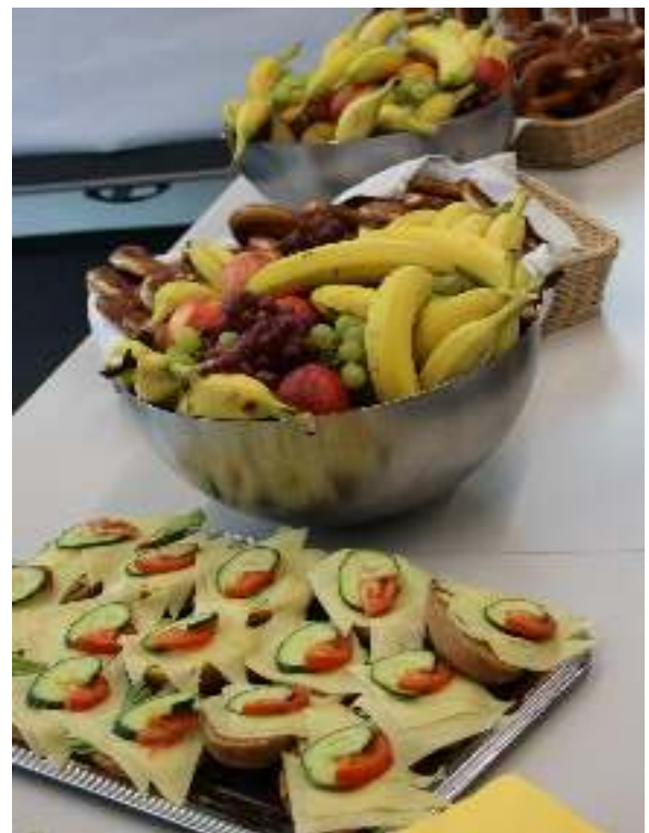
Auch für das leibliche Wohl war gesorgt.